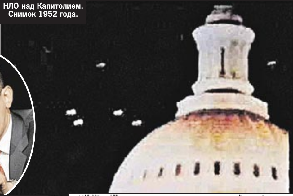
НЛО над Капитолием. Снимок 1952 года.

разобрался никто. Отчасти сдержал слово лишь Джимми Картер (1977 - 1981), который во время своей президентской кампании повторял: «Я убежден, что НЛО существуют...» При его правлении был открыт доступ к тысячам документов. И даже получено право подавать в суд на скрытые правительственные агентства по всемерному заработавшему закону о свободе информации.