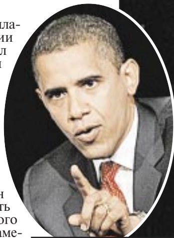
Уфологи ждут от президента-демократа сенсаций.

Обама пока ничего не ответил. Но его предшественники - почти все президенты США XX и XXI веков - клятвенно обещали разобраться. Более того, сами видели НЛО (см. «Президентов США преследуют инопланетяне», «КП» от 18.12.07 и на сайте kp.ru). По мнению уфологов, не